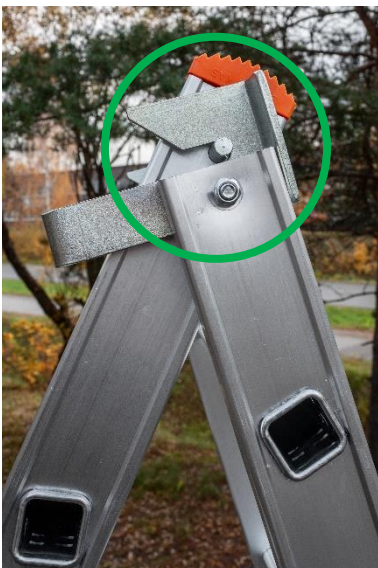
Hingetapp paigal lükandis Redelile ronimine turvaline!