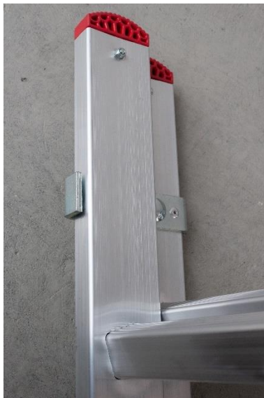
Beslaget på insidan